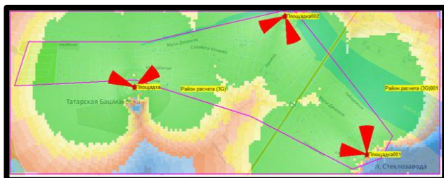
Рис.2 Карта радиопокрытия сети сотовой связи с оценкой распределения уровня мощности поля для стандарта 3G

Размещение станций 4-го поколения произведено на площадках совместно с базовыми станциями 3-го поколения, что позволяет обеспечить оптимальный доступ населения к услугам передачи данных на всей территории села Татарская Башмаковка (Рис.3).